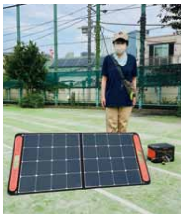
自主防への配備を提案した蓄電池

蓄電池の備蓄を推進するために、ニーズの把握や東京都の補助制度の活用も含めて対策を検討してまいります。