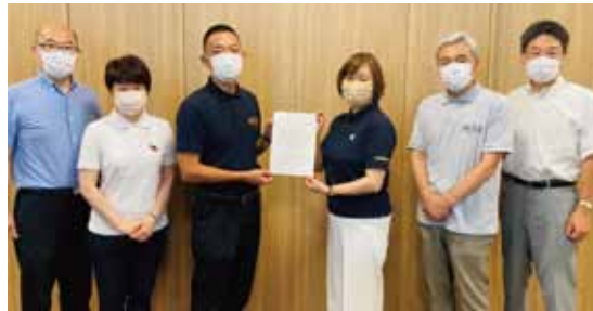
長谷部区長に緊急要望書を提出する渋谷区議会公明党議員団(令和4年7月25日)